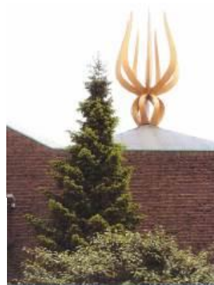
Feest van de Geest, 29 mei t/m 8 juni 2014