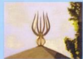
De Hoeksteen Rivierweg 15