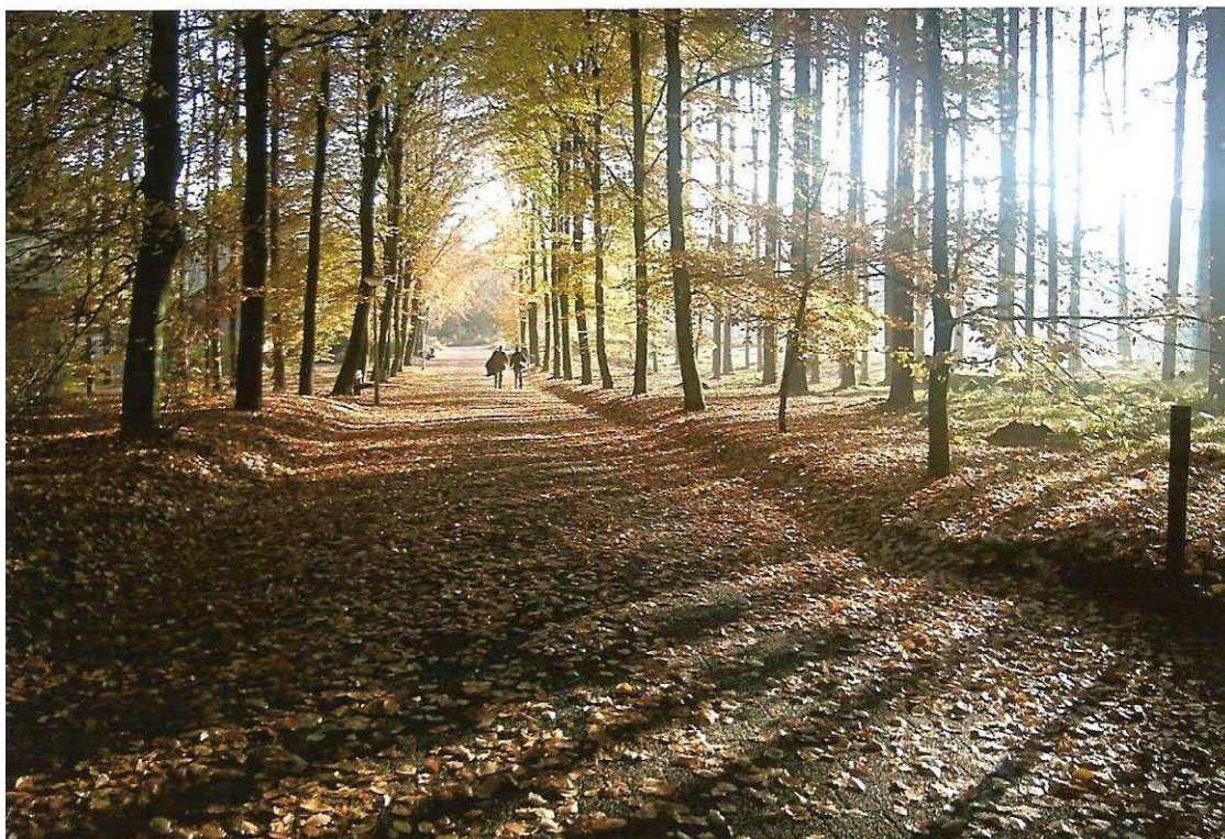
'Familieweekend november 2012'

Postbus 461 2900 AL Capelle aan den IJssel t.010 44 25 361 vrienden@praatatelier.nl bankrekening 3031996 www.afasie.nl/praatatelier kvk Rotterdam nr 244 08 248